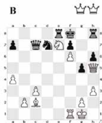
Bílý dá mat třetím tahem