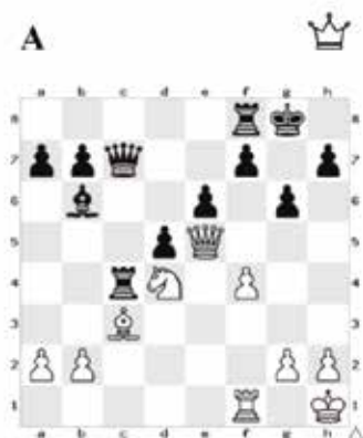
Bílý dá mat třetím tahem