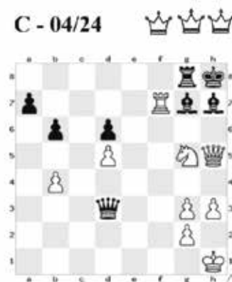
Soutěžní úloha: bílý dá mat třetím tahem