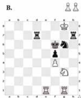
Bílý vyhraje; mat třetím tahem