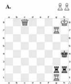
Bílý vyhraje; mat druhým tahem

Zadání šachových úloh. Řešení úloh z minulého čísla naleznete na straně 6.