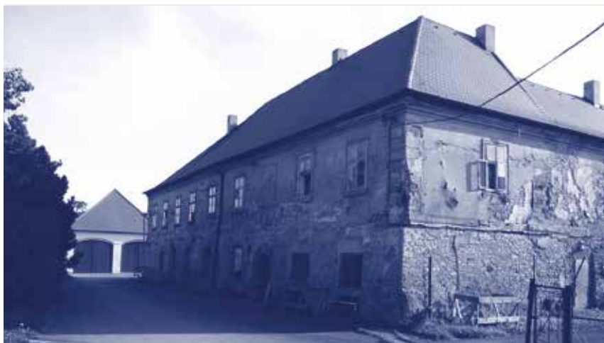
Brandejsovův dvůr – současnost

Jak šel čas, projekt rekonstrukce se odkládal a bohužel i údržba. V polovině roku 2019 pronajalo hl. m. Praha areál ČZU na 20 let s tím, že univerzita bude postupně celý areál rekonstruo-