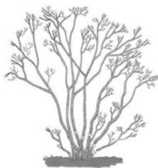
Výchovný řez šeříku obecného

květem a/nebo rostou velice bujně, můžeme řezat i dvakrát v roce: během vegetačního klidu a začátkem léta – ne však až na podzim, aby nové výhony stačily do zimy (mrazů) vyzrát (Ligustrum ptačí zob, Carpinus betulus habr).