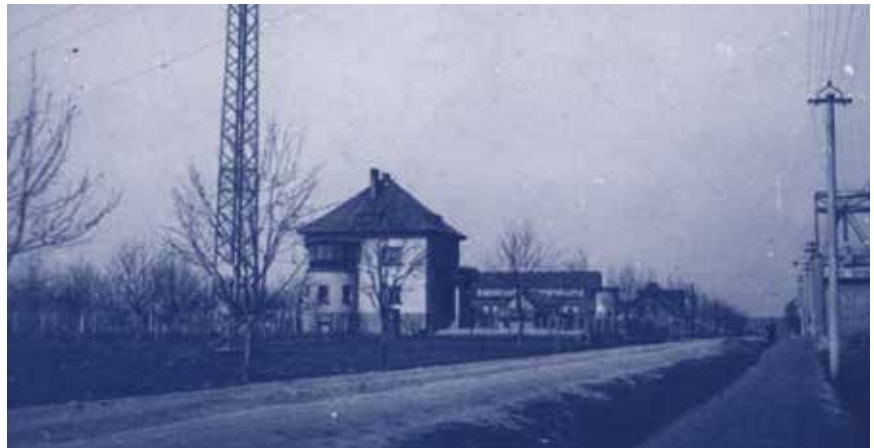
Suchdolská ulice v roce 1942

S výstavbou domů vznikla i potřeba pojmenovat ulice. Jako jedna z prvních ulic byla v roce 1925 pojmenována Na Vrchmezi. Název je odvozen od polohy ulice na vrchní mezi, neboť v okolí se nacházela pole.