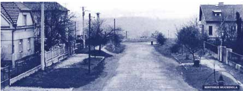
Ulice Za Hájem v roce 1975

Počátkem 20. století převážná část území Sedlce podél Vltavy byla již silně zastavěna, nacházelo se zde několik cihelen, železniční trať, nádraží a pro další rozvoj se již nedostávalo stavebních pozemků. Naopak nad Sedleckými skálami bylo spoustu nevyužitého prostoru. Na přelomu 20. a 30. let 20. století došlo zde tehdy k velké stavební činnosti. Mezi nejstarší domy z té doby patří čp. 73-86.