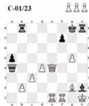
Bílý vyhraje SOUTĚŽNÍ ÚLOHA