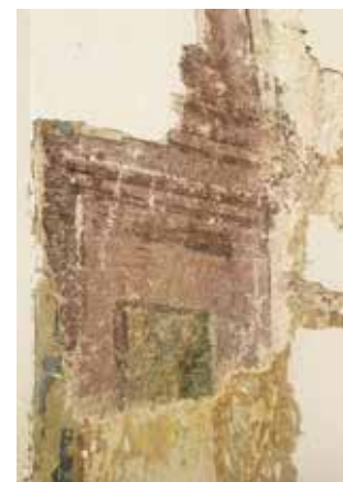
Obr. 12. Iluzivní malba oltářní architektury.

Výsledkem restaurátorských průzkumů byl objev rozsáhlé, patrně celoplošné výmalby interiéru kaple (obr. 3), zřejmě z 2. poloviny 18. století. Jedná se o iluzivní malbu oltářní architektury (obr. 12). Malby jsou provedeny technikou al fresco , tedy malbou do živé omítkové vrstvy. Malovaný oltář je bohatě členěný, se středovým oltářním obrazem s figurálním motivem – pravděpodobně se jedná o sv. Václava, po jehož pravici je dosud neidentifikovaná ženská postava. Niky po stranách lodi kaple jsou taktéž pojednány iluzivní malbou architektury, lze je považovat za menší postranní oltáře s oltářními obrazy uprostřed. Obrazy v nikách zobrazují dva muže: v severní nise je obraz s postavou sv. Benedikta s dlouhým bělavým plnovousem (obr. 13), oděného v černý řeholní hábit, držícího v pravé ruce berlu zakončenou točenicí. V jižní nise je výjev s postavou sv. Prokopa (obr. 14). Jeho šat nese znaky biskupského oděvu – pluviál, zkrácená