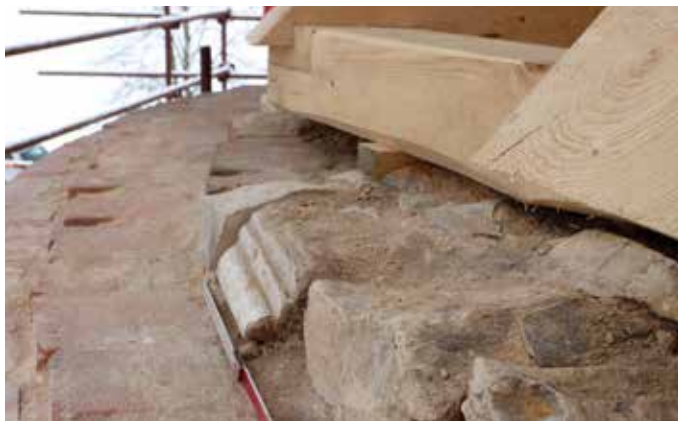
Obr. 16. Druhotně zazděný římsový prvek na koruně zdiva východního závěru (foto L. Bartoš, 2021).

Ve spodní části fasády byla plošně sejmuta omítka, díky tomu bylo v opukovém zdivu objeveno několik kapes v horizontálních řadách nad sebou (obr. 17) v intervalech 0,4 – 1,8 – 2,8 m nad terénem. Některé kapsy zůstaly během průzkumu zazděny a nemohly být do hloubky proměřeny. Zazdívku tvořily úlomky cihel různých formátů, cihlami bylo vyspraveno rovněž zdivo v soklové části