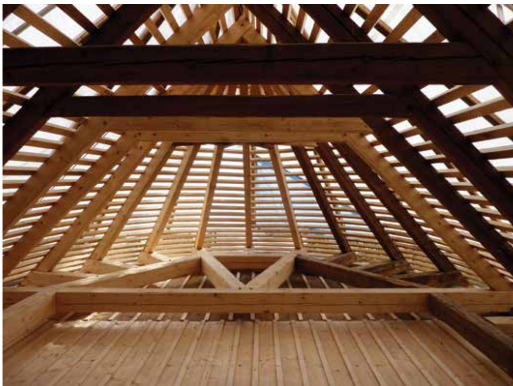
Obr. 10. Neobvyklý pohled do „interiéru“ krovu kaple ještě před položením krytiny. Na snímku je patrné, že poškození krovu nad presbytářem byla zcela fatální a musela zde být provedena kompletní výměna konstrukce. Zcela nové je i laťování střechy. Nejsložitější částí obnovy byla záchrana rákosového podhledu s omítkou a dekorativní pravděpodobně beuronskou výmalbou. Stropní (tzv. rákosníkové) trámy jsou překryty prkennou podlahou. Výmalba stropu evokující hvězdnou oblohu byla restaurována v závěru stavebních prací.

Základním vstupním průzkumem na stěnách kaple byly sondami podchyceny jak mladší vrstvy výmalby (snad z 90. let 20. století), tak stopy starších architektonických úprav zasahujících pod přízdívky. Zároveň byl zjištěn havarijní stav krovu. Hrozilo celkové odstranění stropních konstrukcí, včetně možné výzdoby. V případě nálezu malby bylo třeba najít takové řešení opravy stropu, aby byla zachována původní konstrukce i výzdoba.