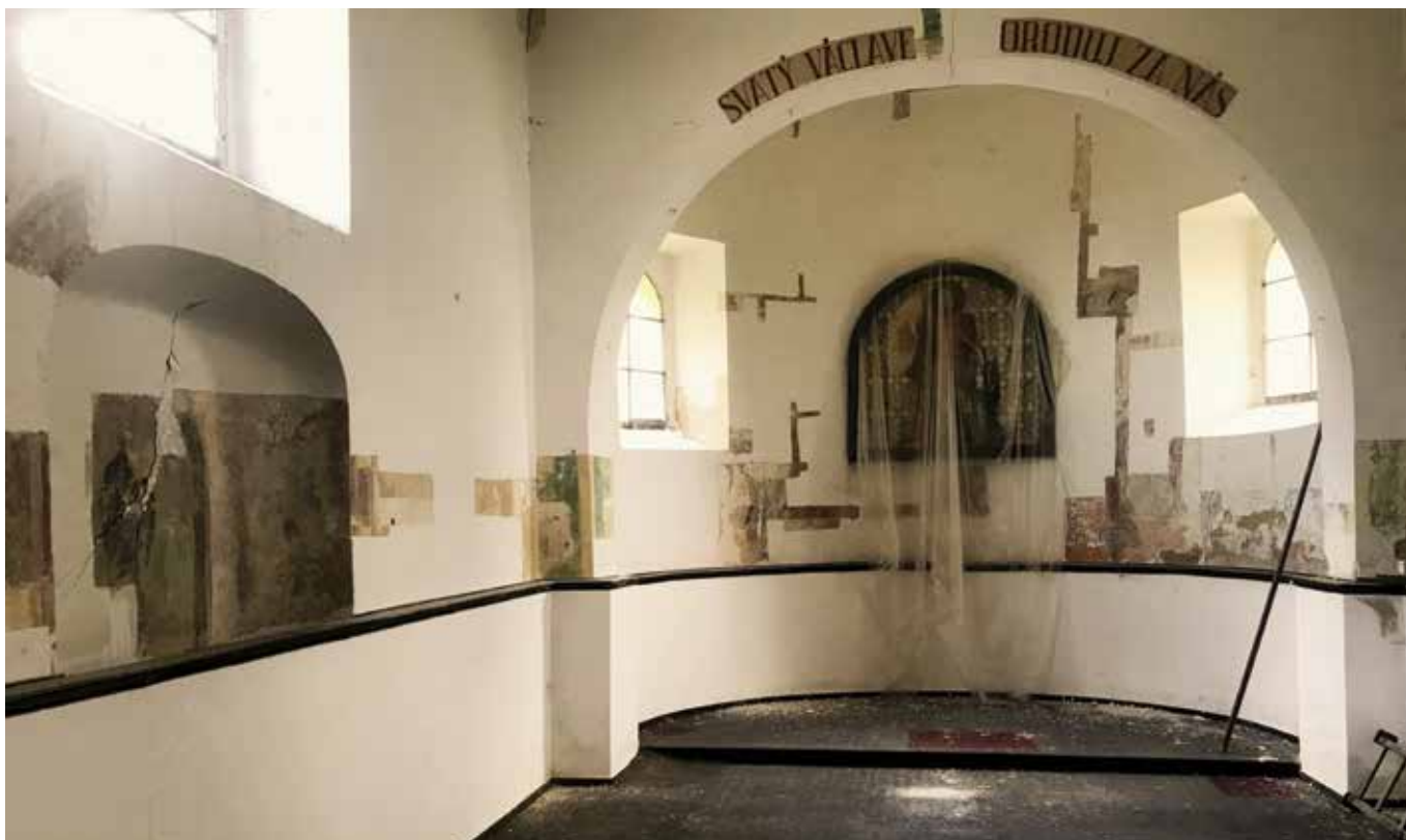
Obr. 3. Interiér kaple před zahájením stavebních prací. Na první pohled je patrná zcela zbytečná a hyzdící obezdívka s jakousi (nefunkční) větrací dutinou.