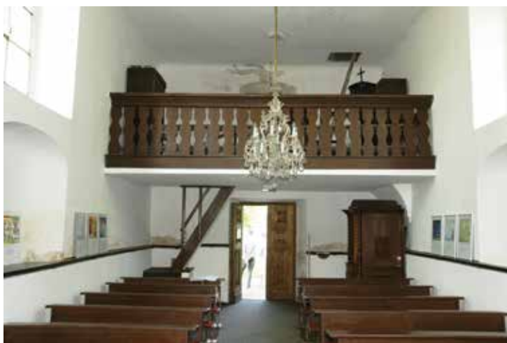
Obr. 11. Interiér kaple v roce 2014 před rekonstrukcí. Niky ve stěnách lodi a dřevěná kruchta na západě.

Vzhledem k nálezu různých omítkových souvrství na stěnách lodi i presbytáře (obr. 12) včetně nápisů, bylo nutné základní sondy