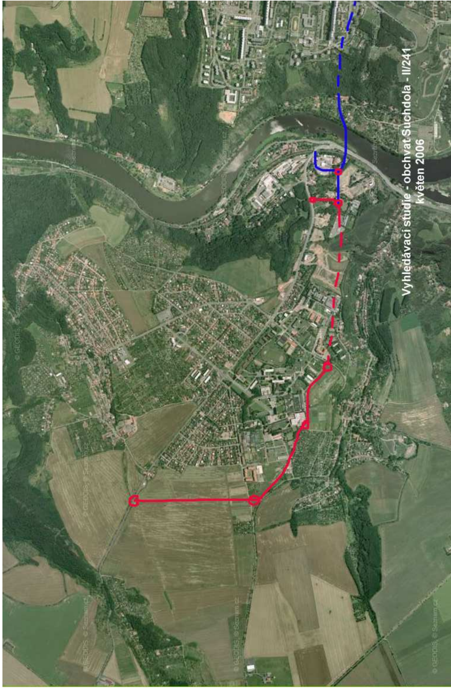
Vyhledávací studie - obchvat Suchdola - II/241 květen 2006