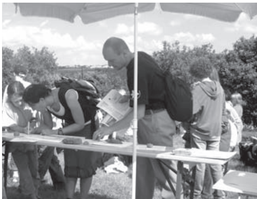
Mnoho účastníků bohoslužby vyjádřilo přímo na místě svůj postoj k ochraně našeho životního prostředí připojením svého podpisu pod petici „Ne 10 miliard“

„Je to extrémní zátěž pro zdraví obyvatel a její rozsah si zatím většinou ani nedokážeme představit. Vést mezinárodní kamiónovou dopravu středem Suchdola a současně nad touto oblastí soustředit veškerý noční letecký provoz v Ruzyni a polovinu všech denních letů je především ukázkou nehorázného přístupu politické reprezentace a vedení příslušných státních podniků k nám, občanům. Nyní se to týká Suchdola a dalších obcí, příště to může být problém právě těch, kteří nás chtějí obětovat.“