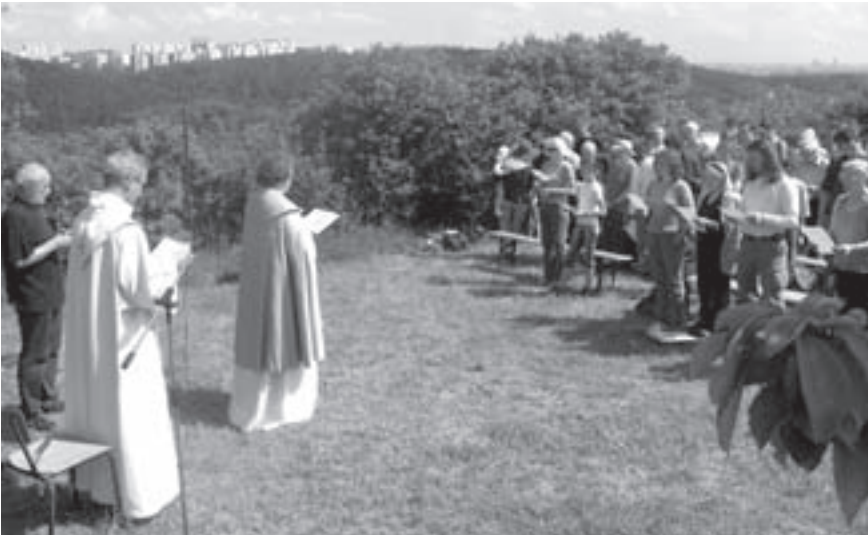
Podnět k bohoslužbě, kterou celebrowali duchovní Obce křesťanů, katolické a evangelické církve, vznikl v rámci občanské snahy o zachování krajiny na severozápadě Prahy, ohrožené plánovanou jižní variantou dálničního okruhu. „Nám pomoz, Pane milý, zažeh temnotu, najdi zbloudilé, oslov hluché, žehnej životu...“ tak zpívali občané z různých míst ohrožené lokality

Louka na Sedleckých skalách, odkud se otevírá jedinečný pohled na údolí kolem Vltavy, se předposlední květnovou sobotu zalila sluncem, které svými paprsky vívalo každého přichozího. Vykouzilo dokonalou atmosféru pro účastníky ekumenické bohoslužby za naši krajinu, kterou uspořádala Ekologická sekce České křesťanské akademie ve spolupráci s občanským sdružením Občané proti hluku a emisím . Magické odpoledne vyvrcholilo společnou modlitbou, aby nádherná příroda kolem nás zůstala zachována i pro další generace, a podpisovou akcí proti svévolnému odhodlání pražského magistrátu ji nevratně zničit.